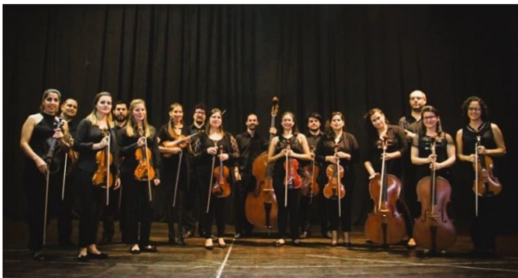
Movimiento Pu Joa. Cortesía

u=https%3A%2F%2Fwww.rdn.com.py%2F2024%2F07%2F26%2Fjoa-celebra-su-decimo-aniversario-con-un-concierto-de-musica-de-camara-contemporanea%2F )