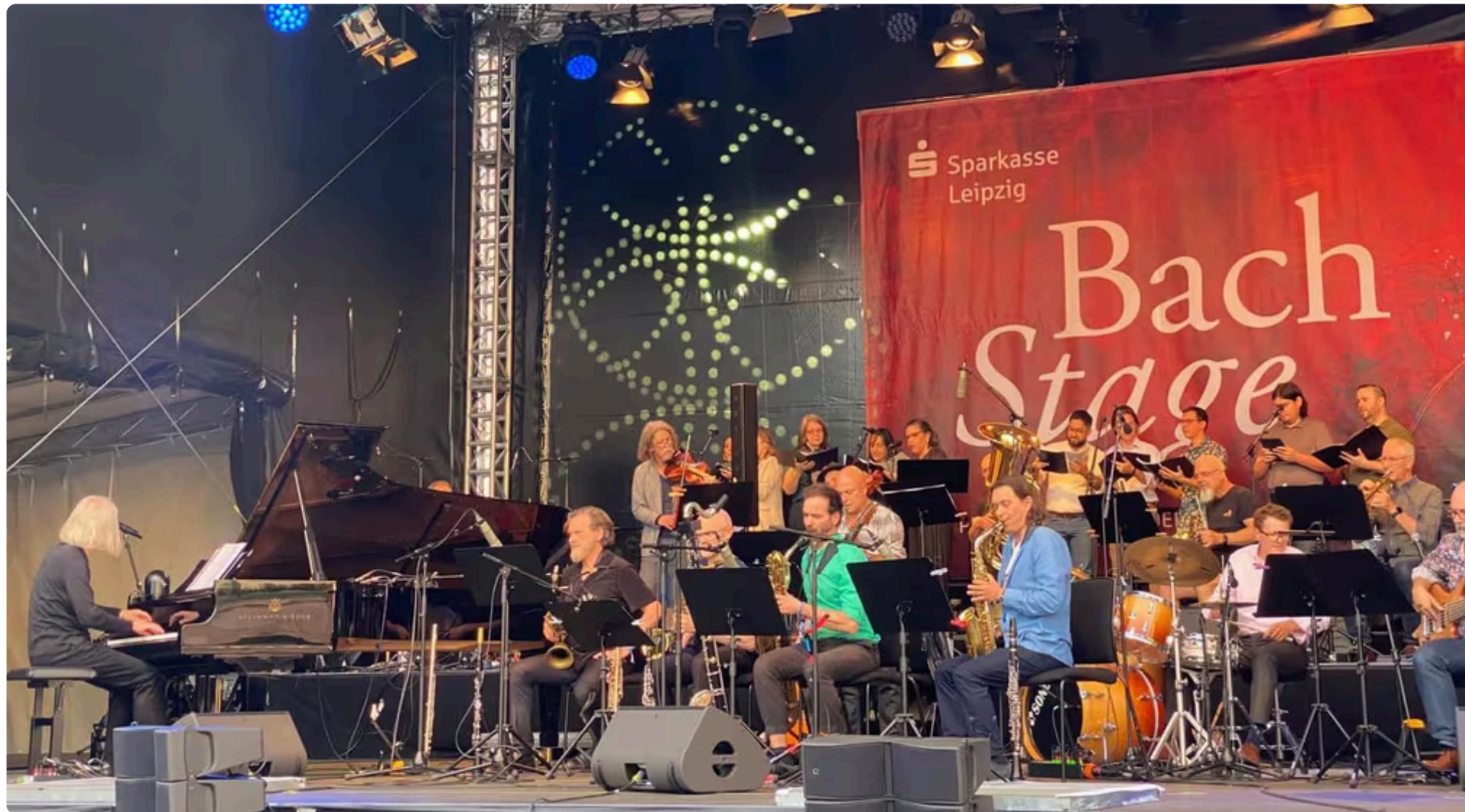
FOTO 1 DE 1 El Bach Collegium de Asunción se presentó en Alemania.

El Bach Collegium de Asunción se presentó en el prestigioso BachFest, desarrollado en Alemania. El ensamble estrenó la obra en guaraní "Kirito ra'arõvo".